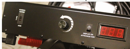
Panel de control superior